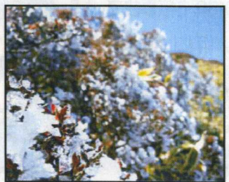
▲ちょうど樹氷が見えました